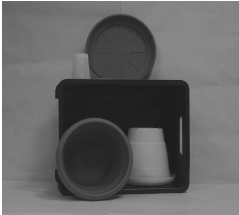
Πρώτη φωτογραφία : Μπροστινή όψη