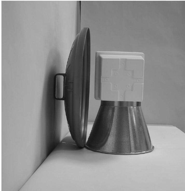
Τέταρτη φωτογραφία : Πλάγια όψη