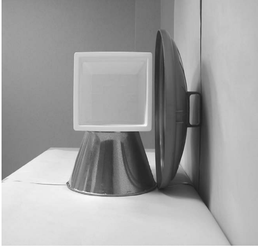
Τρίτη φωτογραφία : Πλάγια όψη